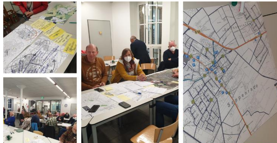
AK 2: Mobilität, Infrastruktur & Wirtschaft → 26.09.2022