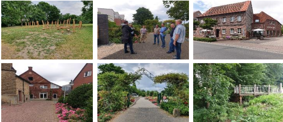
Ortsbegehung → 24.06.2022