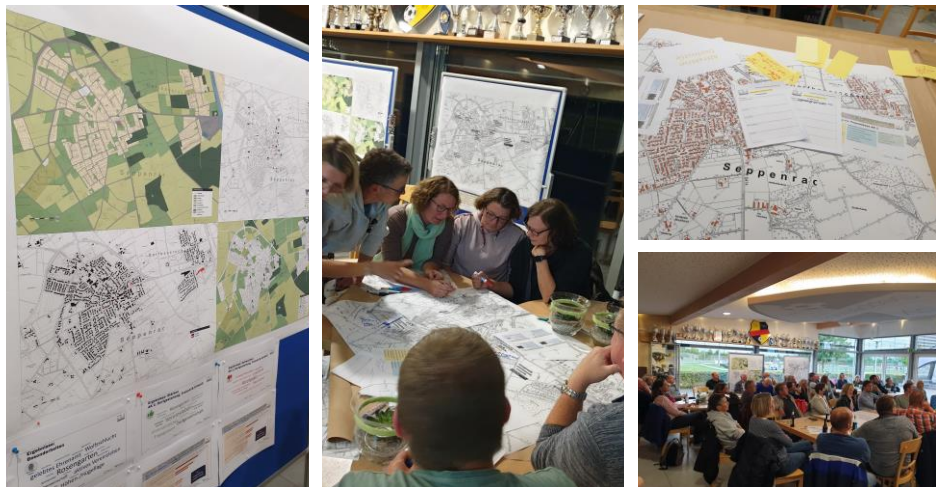
AK 1: Dorfgestaltung, Freizeit & Umwelt → 19.09.2022