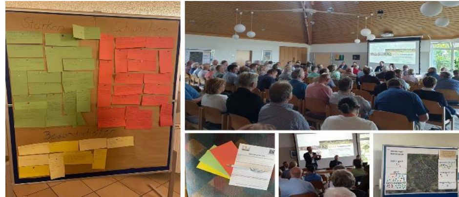
Auftaktveranstaltung → 29.08.2022